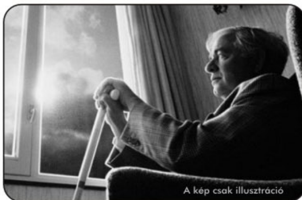
A kép csak illusztráció

ismerőseink is. Az idősek napja alkalmából egész október hónapban ünnepeltünk a Szociális Gondozási Központ és Gyermejjóléti Szolgálat Idősek Klubjába járó klubtagokkal együtt. Az ünnepelés, az eddigi hagyományokkal ellentétben, a Polgári Kistérség többi településén lévő klubjaival, az ottani klubtagokkal közösen történt. Októberben minden hét egy napján más-más település tartott klubfoglalkozást. A mi klubunkban október 14-én került megrendezésre kézműves foglalkozás, ahol gipszből öntött asztali gyertyatartókat és hűtőmagneseket készítettek, illetve festettek a klubvezető segítségével az idősek. A foglalkozáson görbeházi klubtagjaink mellett részt vett húsz fő a környező településekről. A rendezvény jó hangulatban, nótázással, beszélgetéssel telt. Bizunk abban, hogy közös foglalkozásokra a jövőben is lesz lehetőség, hagyományá válik, mert időseink szemmel láthatóan jól érezték magukat.