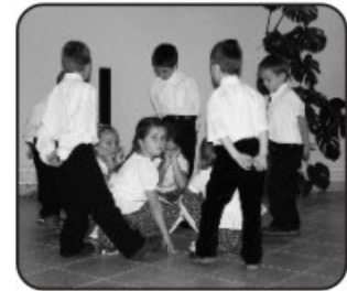
Óvodások kis műsorral készültek