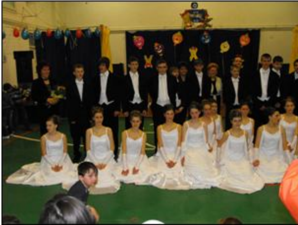
osztályosaink mint törökök arattak nagy sikert.

Mindkét napon a farsangi rendezvényünk nagyon sikeres volt. A tanítványaink a pedagógusok segítségével fantasztikus műsorral szórakoztatták a közönséget. Volt zene, tánc, szórakozás, vidám jelent. Mindenki válogathatott kedvére, hisz jobbnál jobb műsorszámok követték egymást. Gyönyörködhettünk a kis elsőseink ruhakölteményeiben, orosz néptáncában. A második osztályosok mint törpék, a harmadik