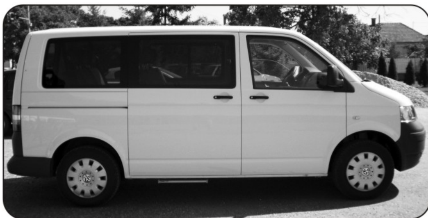
VW Transporter 2.5 tdi, 130 LE, a gépjármű egyéb funkcióin túl RENDELKEZIK AKADÁLYMENTES 1 DB KERKESSZÉK ELHELYEZÉSÉRE KIALAKÍTOTT RÉSSZEL, MOBIL RÁMPÁVAL IS.

A helyi újság egy korábbi számában már tájékoztattam az olvasókat arról, hogy pályázaton nyertünk tanyagondnoki szolgáltatásunk biztosításához egy Volkswagen Transporter típusú kilenc személyes autót. A pályázati támogatás összege 8.353.000 Ft, az önkormányzat további 2.167.000 Ft-ot biztosított önrészként, hogy megvalósulhasson a régóta kívánt gépjármű beszerzése. Az autó elsősorban a külterületen élők orvoshoz, óvodába, iskolába, és más közintézményekbe történő személyszállítását szolgálja, így stílszerűen Bagotán, ünnepélyes keretek között történt a