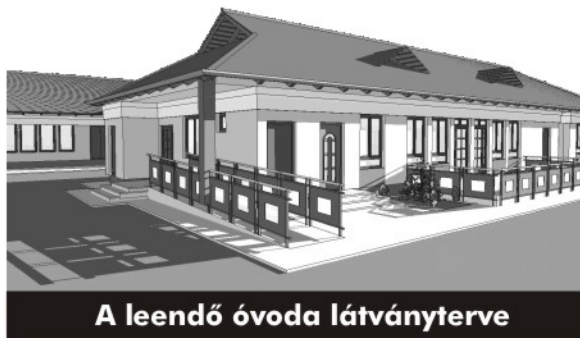
A leendő óvoda látványterve

2008 őszén derült ki az az örömteli hír, hogy a beadott pályázat előzetes támogatási döntésben részesült... folytatás a 3. oldalon.