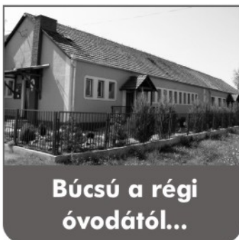
Búcsú a régi óvodától...

Az óvoda épületének bővítése és felújítása miatt egy nevelési évre az óvodások és a bölcsődések az iskolába költöztek.