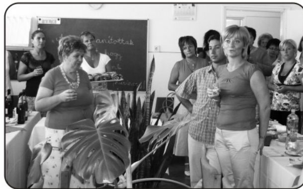
Dr. Pusztali Adél (polgármester) - köszönti a GÚT első tanévnyitó értekezletén a pedagógusokat

De ebben a tanévben ennek a tantestületnek több is lesz a feladata. Meg kell tapasztalnunk a közös munka, az összefogás erejét. Kell, hogy eredményeket tudjunk felmutatni. De azt is tudjuk, hogy az eredményeket csak nemes edzettséggel, kitartással és