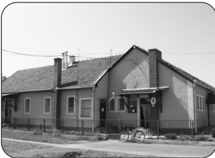
A régi óvoda hamarosan megszépül

életére befolyással lesz ez a megoldás, de a lehetőségek közül ez volt a legmegfelelőbb. Úgy gondolom átgondolt szervezéssel, megfelelő alkalmazkodással tudjuk biztosítani a gyermekek számára a derűs, nyugodt légkört akár bölcsődésről vagy óvodásról, illetve iskolásról legyen