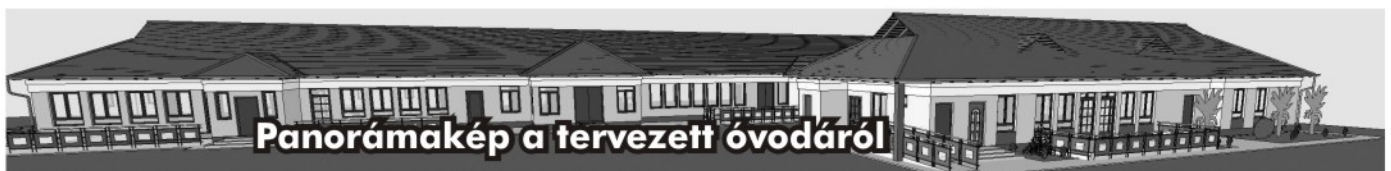
Panorámakép a tervezett óvodáról