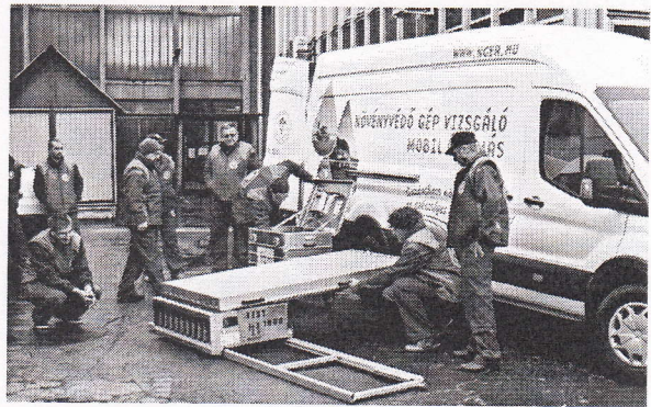
A kontrolláló rendszer egyik nagy előnye a mobilitás

Felülvizsgálják a több mint hároméves permetezőgépek műszaki állapotát. Az országban hamarosan huszonnégy mobil alállomás működik majd, és akár a gazda telephelyén is elvégezhetik a vizsgálatot. A gazdáknak december 14-ig meg kell rendelniük az ellenőrzést.